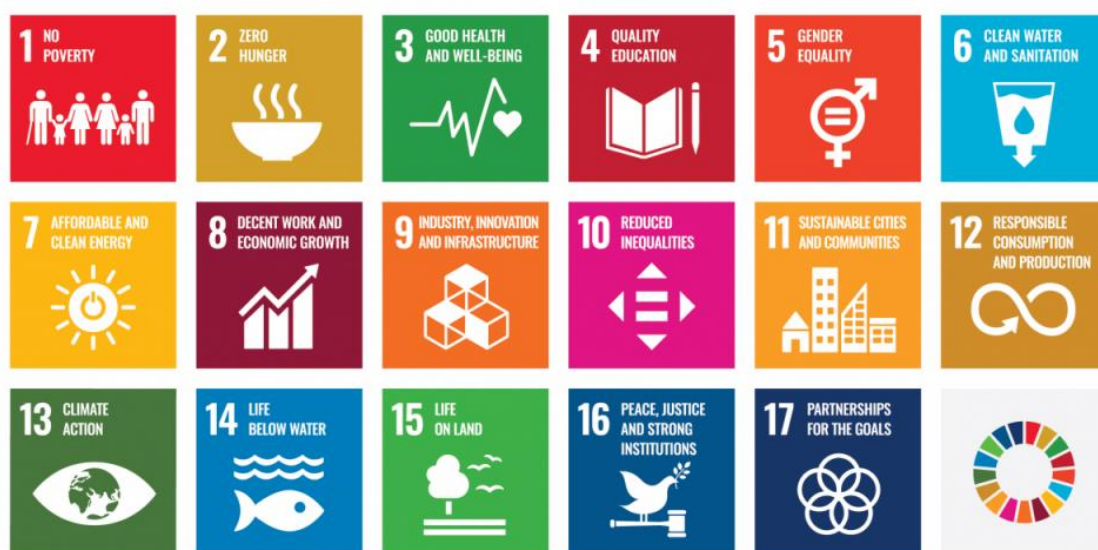
ภาพที่ ๓ - ๑ ภาพแสดงเป้าหมายการพัฒนาที่ยั่งยืน (Sustainable Development Goals : SDGs)

สำหรับเป้าหมายการพัฒนาที่ยั่งยืนที่เกี่ยวข้องกับสุขภาพและการป้องกันควบคุมภัยโรคติดต่อ ได้แก่ เป้าหมายการพัฒนาที่ยั่งยืนที่ ๓ สร้างหลักประกันว่าคนมีชีวิตที่มีสุขภาพดีและส่งเสริมสวัสดิภาพสำหรับทุกคนในทุกวัย (Ensure healthy lives and promote well-being for all at all ages) หรืออาจเรียกได้ว่าเป็นเป้าหมายด้านสุขภาพดี มีสวัสดิภาพ (Good health and well-being) ซึ่งครอบคลุมประเด็นด้านสุขภาพและสวัสดิภาพ ที่สำคัญหลายประเด็น มีประเด็นที่เกี่ยวข้องกับการป้องกันควบคุม กำจัด กวาดล้างโรคติดต่อ และการจัดการความเสี่ยงด้านสุขภาพ ได้แก่