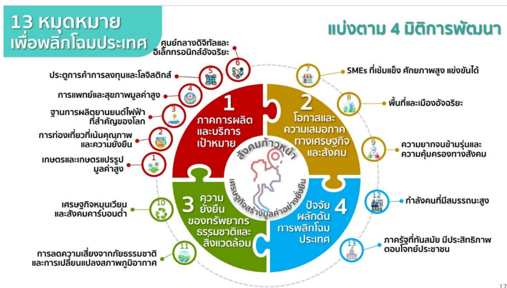
ภาพที่ ๒ - ๓ ภาพแสดงกรอบแผนพัฒนาเศรษฐกิจและสังคมแห่งชาติ ฉบับที่ ๑๓

สำนักงานสภาพัฒนาการเศรษฐกิจและสังคมแห่งชาติ จึงได้ดำเนินการจัดทำแผนพัฒนาเศรษฐกิจและสังคมแห่งชาติ ฉบับที่ ๑๓ ให้เป็นแผนที่มีความชัดเจนในการกำหนดทิศทางและเป้าหมายการพัฒนาประเทศที่ต้องการมุ่งเน้น โดยเริ่มต้นจากการสังเคราะห์ วิเคราะห์แนวโน้ม พร้อมทั้งผลกระทบจากการเปลี่ยนแปลงที่อาจเกิดขึ้นทั้งภายในประเทศ ภูมิภาค และระดับโลก เพื่อประเมินความท้าทายและโอกาสในการพัฒนาประเทศภายใต้บริบทเงื่อนไข ข้อจำกัดที่ประเทศไทยต้องเผชิญอันเนื่องมาจากการเปลี่ยนแปลงดังกล่าว โดยพิจารณาองค์ประกอบของการพัฒนาประเทศในมิติด้านต่างๆ ที่มีความเชื่อมโยงหรือเป็นองค์ประกอบของประเด็นยุทธศาสตร์ที่ระบุไว้ในยุทธศาสตร์ชาติอย่างรอบด้าน ก่อนนำมาสู่การกำหนดจุดเน้นเชิงเป้าหมายที่ประเทศไทยต้องให้ความสำคัญและมุ่งเน้นดำเนินงานให้บรรลุผลในระยะของแผนพัฒนาฯ เพื่อให้ประเทศพร้อมเติบโตอย่างยั่งยืนและสามารถบรรลุเป้าหมายการพัฒนาประเทศภายใต้ยุทธศาสตร์ชาติได้อย่างสัมฤทธิ์ผล