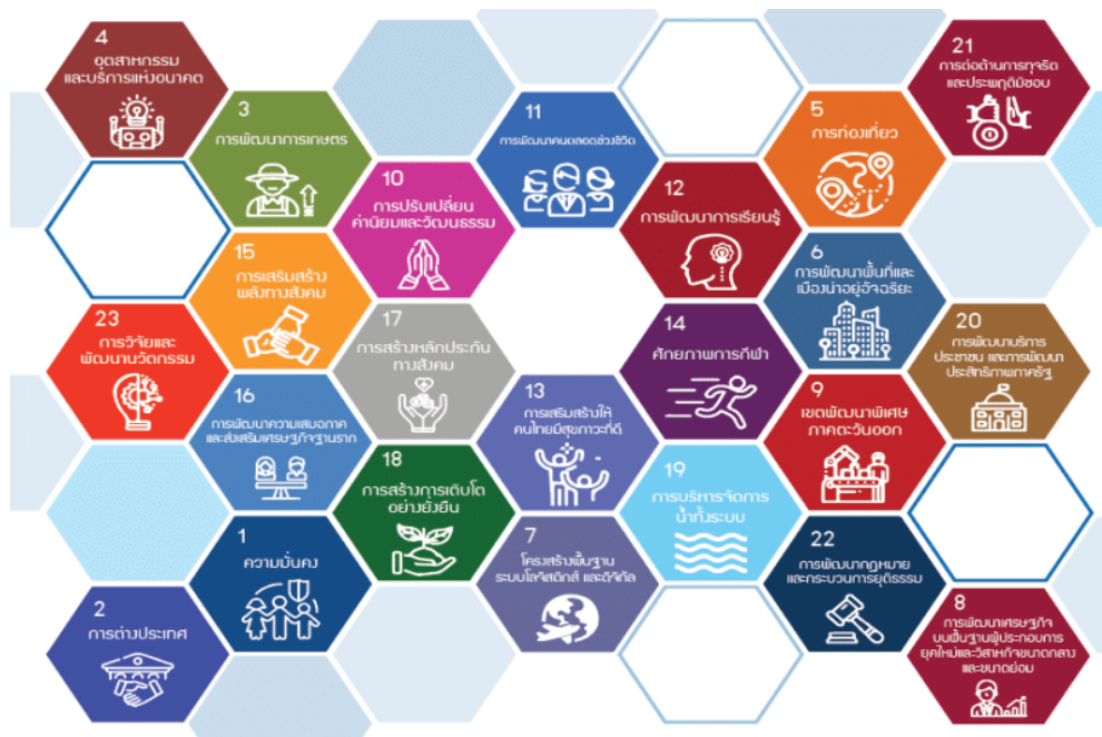
ภาพที่ ๒ - ๒ ภาพแสดงแผนแม่บทภายใต้ยุทธศาสตร์ชาติ ๒๓ แผนแม่บท

แผนแม่บทภายใต้ยุทธศาสตร์ชาติทั้ง ๒๓ ประเด็น เป็นการกำหนดประเด็นในลักษณะที่มีความบูรณาการและเชื่อมโยงระหว่างยุทธศาสตร์ชาติด้านที่เกี่ยวข้อง และประเด็นการพัฒนาจะไม่มี ความซ้ำซ้อนกันระหว่างแผนแม่บทฯ เพื่อให้ส่วนราชการสามารถนำแผนแม่บทฯ ไปใช้ในทางปฏิบัติได้อย่างมีประสิทธิภาพและป้องกันการเกิดความสับสน โดยแผนแม่บทภายใต้ยุทธศาสตร์ชาติเป็นแผนระดับ ๒ ที่มีความสำคัญในการเป็นแนวทางการพัฒนาและขับเคลื่อนประเทศเพื่อให้บรรลุตามเป้าหมายของยุทธศาสตร์ และถ่ายทอดไปสู่แนวทางในการปฏิบัติในแผนระดับ ๓ ของหน่วยงาน ตามนัยมติคณะรัฐมนตรีเมื่อวันที่ ๔ ธันวาคม ๒๕๖๐ แผนแม่บทภายใต้ยุทธศาสตร์ชาติทั้ง ๒๓ ประเด็น จึงมีการกำหนดองค์ประกอบของแผนตามหลักการความสัมพันธ์เชิงเหตุผล ที่ต้องมีการระบุแนวทางการพัฒนาและการดำเนินแผนงาน/โครงการต่างๆ ที่ต้องสามารถสะท้อนผลสัมฤทธิ์ของเป้าหมายของยุทธศาสตร์ชาติด้านที่เกี่ยวข้องได้อย่างเป็นรูปธรรม